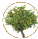
PIANTE DA FRUTTO