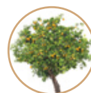
PIANTE DA FRUTTO

ALTRE COLTURE: Olivo, Vite e Piccoli frutti.